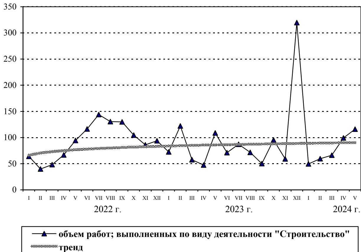
ДИНАМИКА ОБЪЕМА РАБОТ, ВЫПОЛНЕННЫХ ПО ВИДУ ДЕЯТЕЛЬНОСТИ «СТРОИТЕЛЬСТВО» (в процентах к среднемесячному значению 2021 г.)