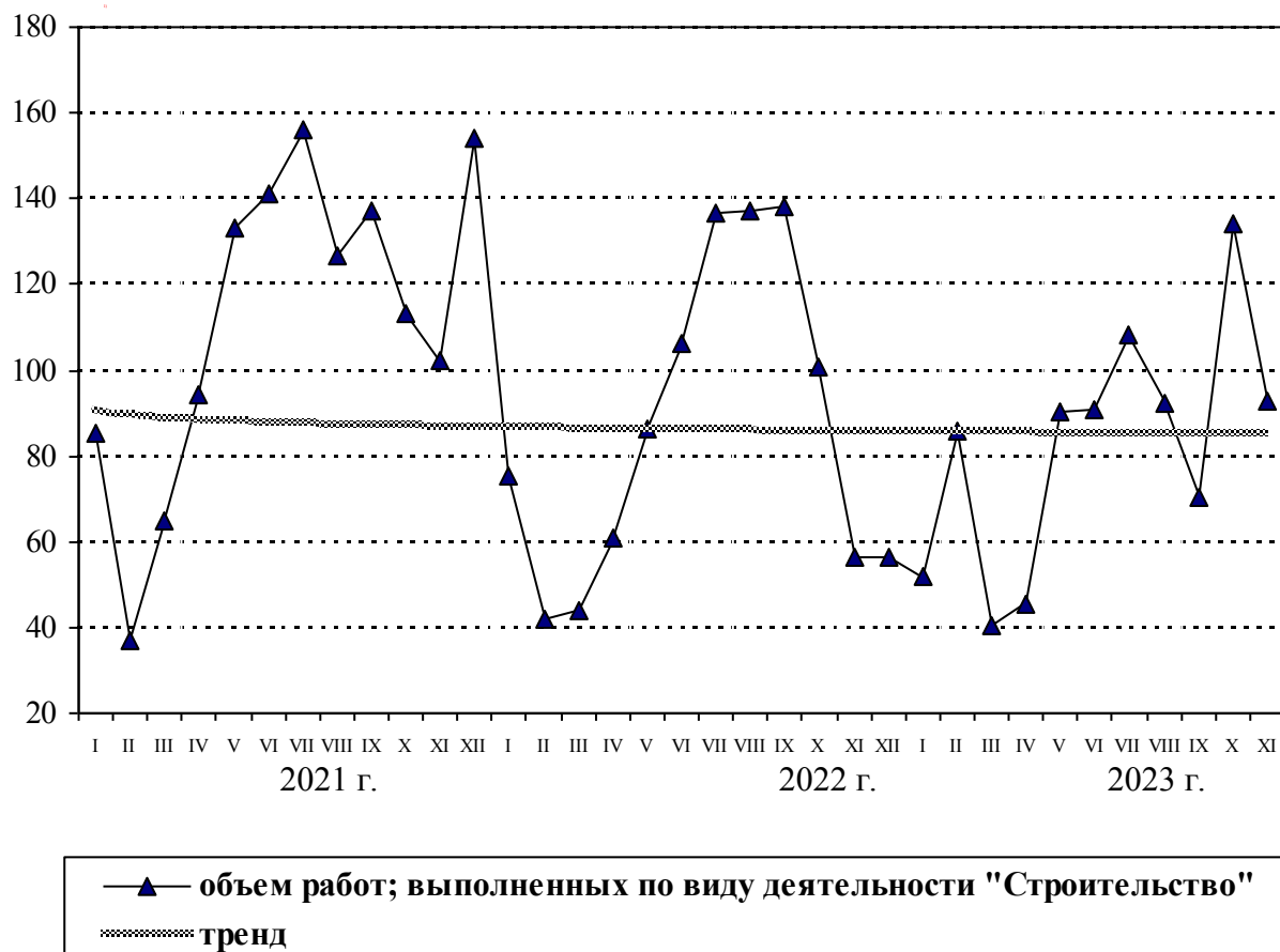
ДИНАМИКА ОБЪЕМА РАБОТ, ВЫПОЛНЕННЫХ ПО ВИДУ ДЕЯТЕЛЬНОСТИ «СТРОИТЕЛЬСТВО» (в процентах к среднемесячному значению 2020 г.)