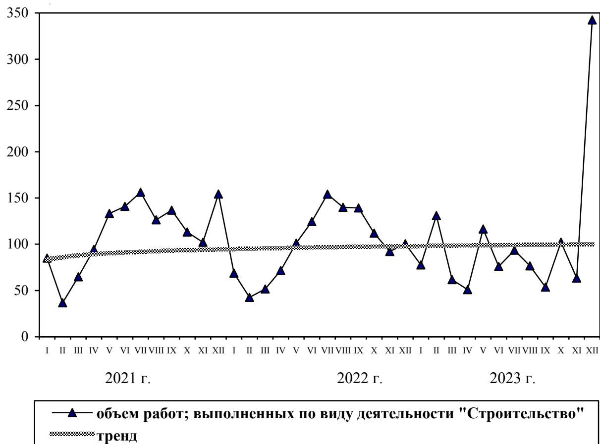
ДИНАМИКА ОБЪЕМА РАБОТ, ВЫПОЛНЕННЫХ ПО ВИДУ ДЕЯТЕЛЬНОСТИ «СТРОИТЕЛЬСТВО» (в процентах к среднемесячному значению 2020 г.)